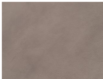
BYRON 4005 MERCURIO