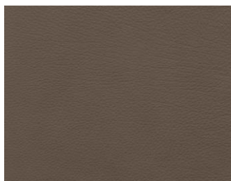
NATURE 74 TERRA