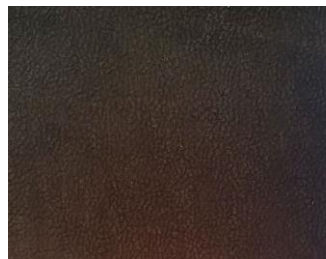
Dunkelbraun hnědá tmavá