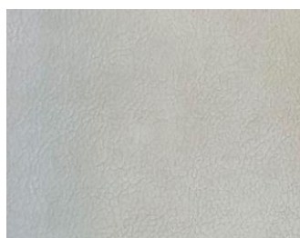
Hellgrau šedá světlá