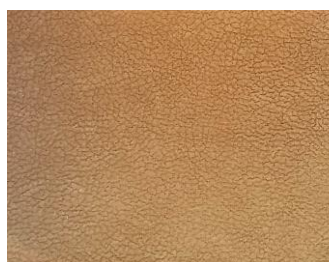
Hellbraun hnědá světlá