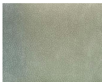
Hellgrün zelená světlá