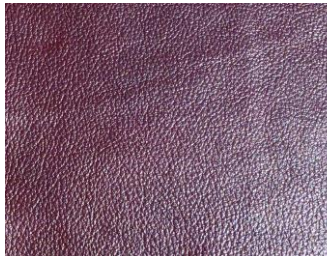
Bordeaux bordó tmavá

Poznámka: Barevný odstín a struktura povrchu je pouze orientační.