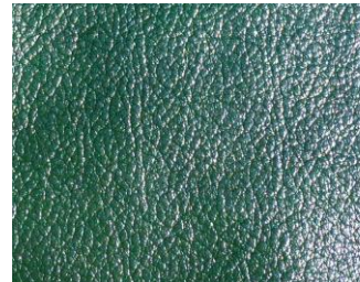
Grün zelená tmavá